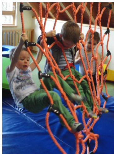
„Wach, neugierig und klug sind wir von Anfang an“