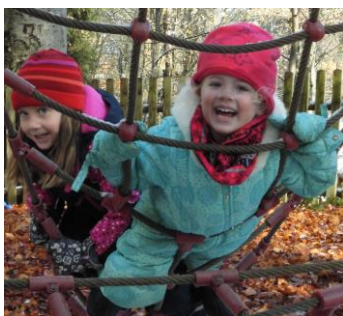
„Ich kann was bewegen“

Die oben genannten Kompetenzen entwickeln sich nicht isoliert, sondern überschneiden und bedingen sich gegenseitig.